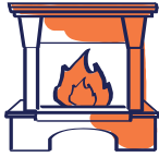
Feu de cheminée