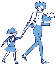
Maman marchant avec sa fille